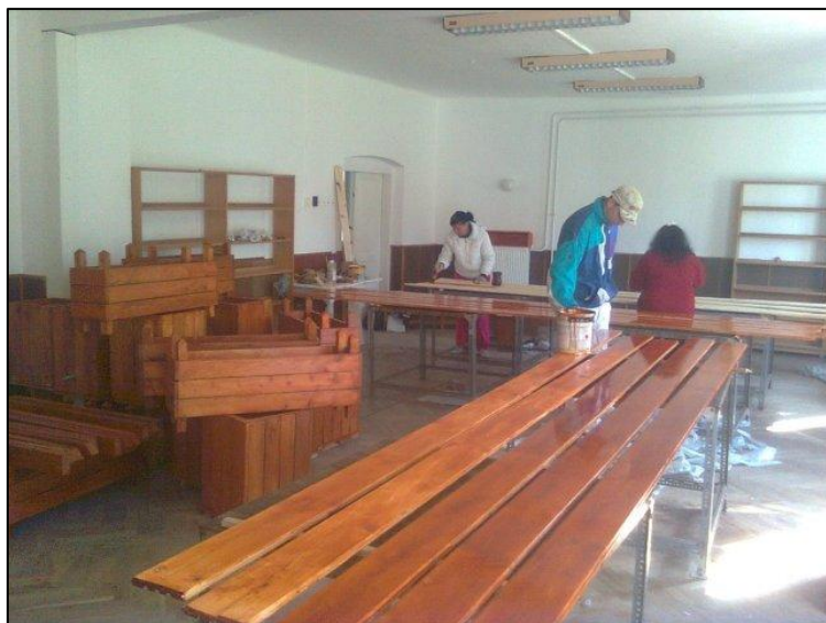
Az asztalos műhelyben már a festésnél tartanak

A Gyermekeinkért Alapítvány virágládák és padok készítésére nyert pályázatot, melynek címe: A virágos Döbrököz. A LEADER pályázat keretében már folyamatosan készül virágládák és padok hamarosan kihelyezésre kerülnek.