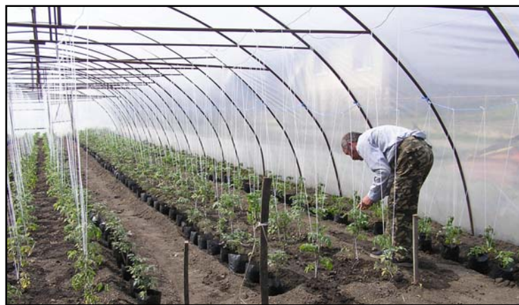
A kertészetben egyébként már kis paradicsom, saláta és spenót is van a fólia alatt

Igen, a lényeg ennek a szemléletnek az erősítése, amit itt a kertészetben is alkalmaznak. Ők is tudják: a falvak a jövőben csak így tudnak megmaradni. Csak a független, cselekedni képes, magáért is dolgozni tudó és akaró emberek élettere a falu. Isten őket segíti meg. (ft)