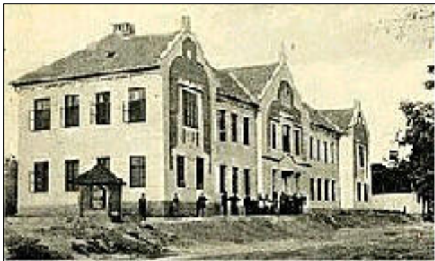
Iskolánk 100 évvel ezelőtt

(Idézet a kiállításon látható 70 éves tankönyvből)